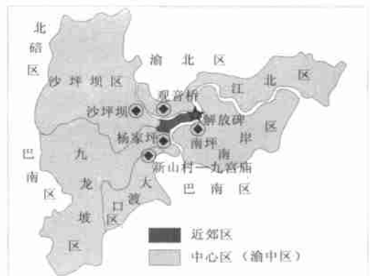
图 1 重庆市中心区与近郊区示意图